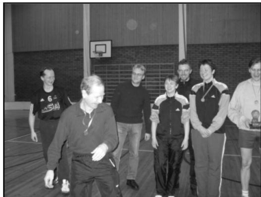
Kuva. Lentopalloturnauksen iloisia palkintojenjakotunnelmia viime vuodelta.

Terveisin Antsu Karvinen, Lentopallovastava, 0400 152547