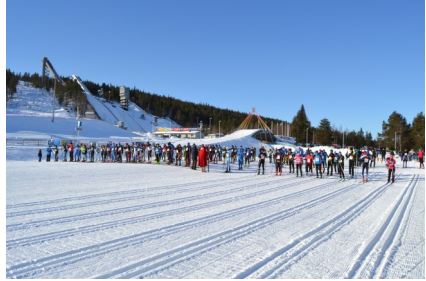
60km valmiina starttiin...