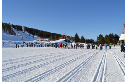
20 km valmiina starttiin..