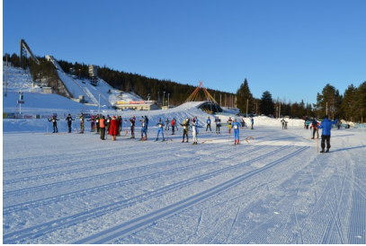
100km valmiina starttiin...