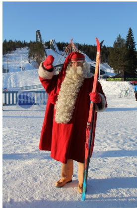
Joulupukki toivotti hyvää matkaa hiihtäjille