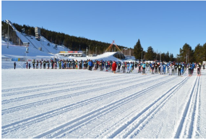
40 km valmiina starttiin...