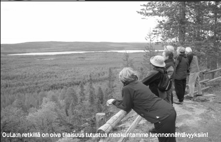
OuLa:n retkillä on oiva tilaisuus tutustua maakuntamme luonnonnähtävyyksiin!

Suomen Ladun 54. Leiripäivät Vantaan Hakunilassa 1.-3.7.2011