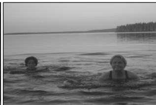
Ulingasjoen myllyn historiaa ...