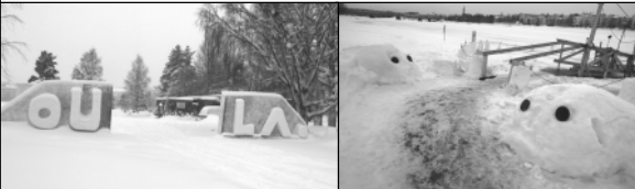
Kuvissa viime talven upeita lumirakenteita ja -veistoksia Koskipuistossa.