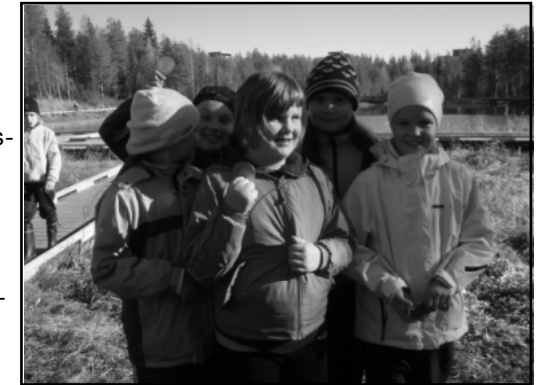
Kuva. Geokätköilyä kimpassa koululla

Helsingissä nuorten Your Move tapahtumaan osallistuminen. Move-ohjaaja tukena.